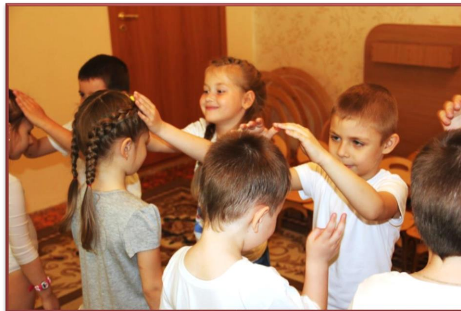
Упражнение «Солнечный зайчик»

Благодаря проведению целенаправленной деятельности по развитию эмоционального благополучия в течение учебного года, в детском саду легко проходит адаптационный период для вновь пришедших детей; увеличивается количество детей с преобладанием хорошего настроения и положительных эмоций, отмечается улучшение взаимодействия воспитанников со сверстниками, эмоциональное сплочение детей в группах.