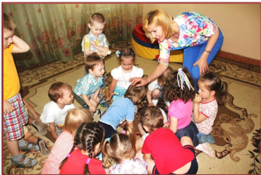
Игра «Разбуди медвежонка»

На занятиях детям предлагаются игры по развитию группового сплочения, внимательного и бережного отношения к сверстникам, упражнения в парах, проводится психогимнастика, разучиваются потешки.